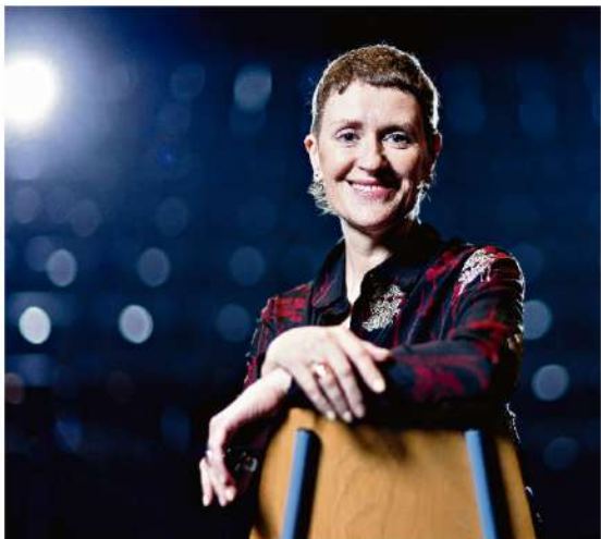
La directrice du Théâtre Sèvefin le 26, le 21 février 2024, à Lausanne.